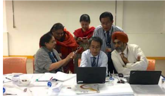
Medische professionals bezig met een tRat tijdens een TBL-workshop