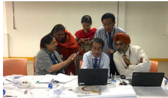
Medische professionals bezig met een tRat tijdens een TBL-workshop